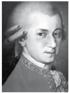
Wolfgang Amadeus Mozart, vollständiger Name: Johannes Chrysostomus Wolfgangus Theophilus Mozart Ölgemälde, 1891 von Barbara Krafft