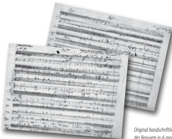
Original handschriftliche Notenblätter des Requiem in d-moll

Opfer und Gebet bringen dir, Herr, lobsingend wir dar. Nimm es gnädig an für jene Seelen, deren wir heut´ gedenken: Lass sie, o Herr, vom Tode zu dem Leben übergehen, welches du verheissen hast Abraham und seinem Geschlechte.