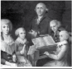
Mozart (am Klavier) musiziert mit dem gleichaltrigen Thomas Linley (Violine) Florenz 1770