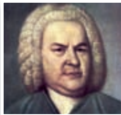
Johann Sebastian Bach im Jahre 1746. Ölgemälde von Elias Gottlob Haubmann